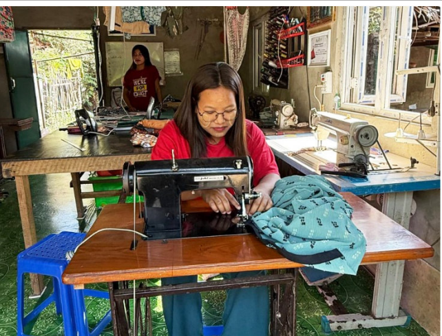
Näherinnen bei der Arbeit