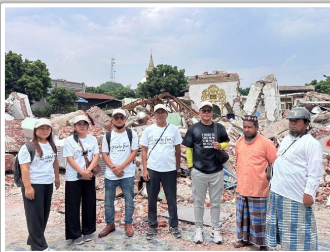
Ein Team von Thukha Myanmar bringt betroffenen Menschen im Erdbebengebiet Hilfe.

Dank spezifischer Spenden konnten wir über unsere lokalen Teams gemeinsam mit Vision Ost den vom Erdbeben betroffenen Menschen rasch und gezielt Hilfe im Umfang von rund 10'000 Franken leisten.